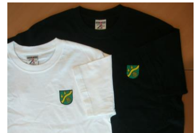
T-Shirt (weiß oder schwarz): 10,00 € 100% Baumwolle, gesticktes Wappen (Größen: 140, 152, XS, S, M, L, XL)