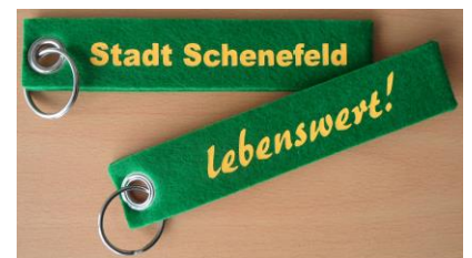
Filz-Schlüsselanhänger: Stück 2,90 €