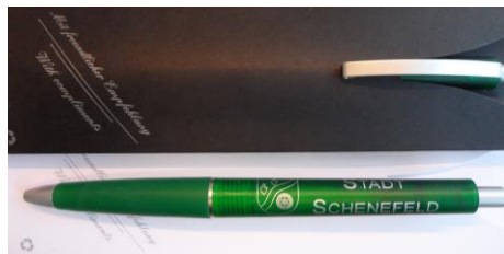
Kugelschreiber „Stadt Schenefeld“: 1,00 € (inkl. Etui): 1,20 €