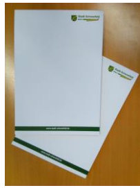
Notizblock: 0,60 € (DIN A5, 50 Blatt)