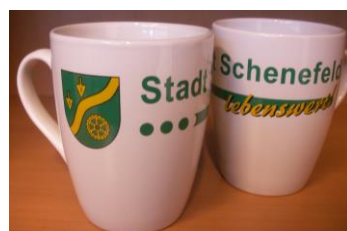
Kaffebecher: Stück 3,30 €