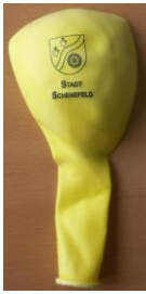
Luftballon: 0,20 € (grün oder gelb)