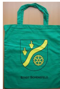
Stoffbeutel: 2,00 €