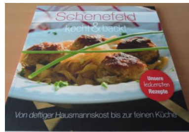
Kochbuch: 12,95 € Jahrgang 2012, 134 Seiten