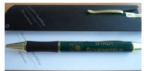
Kugelschreiber „metallic“: 3,80 € (inkl. Etui): 4,00 €