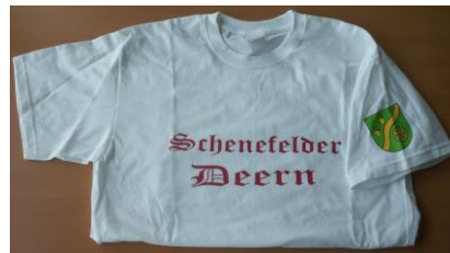
T-Shirt „Schenefelder Deern“: 5,00 € (Größen: 140, 152, 164, S, M, L, XL)