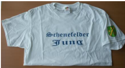
T-Shirt „Schenefelder Jung“: 5,00 € (Größen: 140, 152, 164, S, M, L, XL)