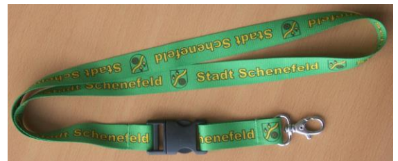
Schlüsselband: 1,40 €