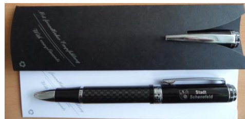
Kugelschreiber „Carbon“: 8,50 € (inkl. Etui): 8,70 €