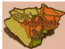
Ansteckpin: 1,70 € (Breite: ca. 3,5 cm)