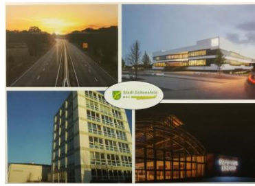
Postkarte „Lebenswert“: 0,70 €