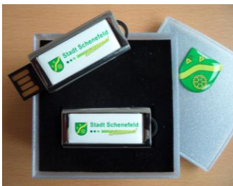
USB-Stick, 8 GB: Stück 11,00 € (inkl. Geschenkbox): 13,00 €