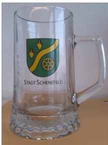
Bierseidel 0,4 l: 5,80 €