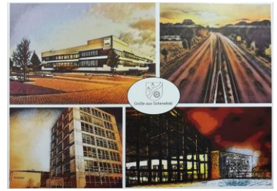
Postkarte „Vintage“: 0,70 €