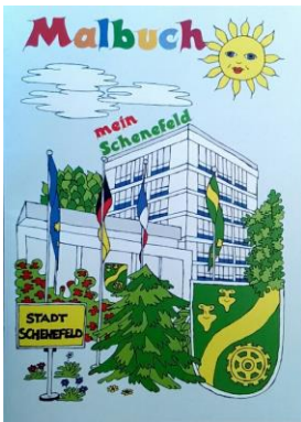
Malbuch: 1,40 € (Größe DIN A4)