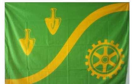
Hissflagge: 18,00 € Größe: 100 x 150 cm, Material: Polytex, echtfarbig durchgedruckt, Stangenseite mit Bund und Kunststoffhaken