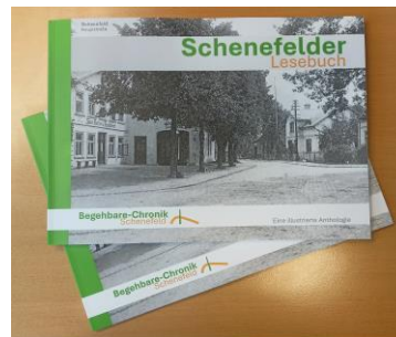
Schenefelder Lesebuch Softcover, 90 Seiten: 10,00 €