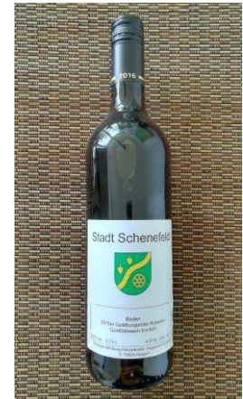
Rotwein 0,75 l: 5,60 € 2016er Spätburgunder