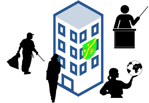
Stadtverwaltung & Liegenschaften