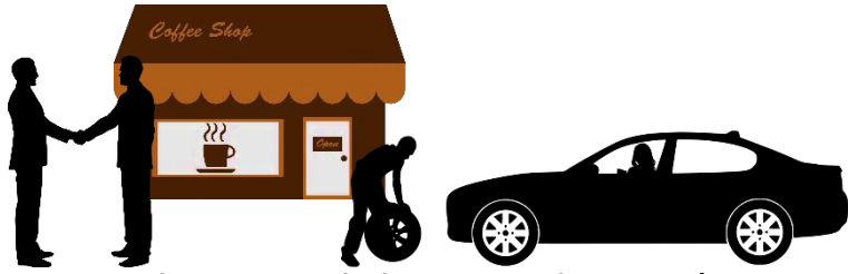
Gewerbe, Handel, Dienstleister*innen