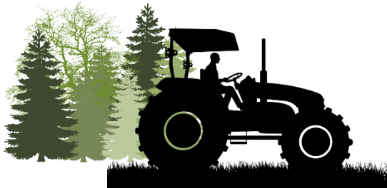
Land- und Forstwirtschaft