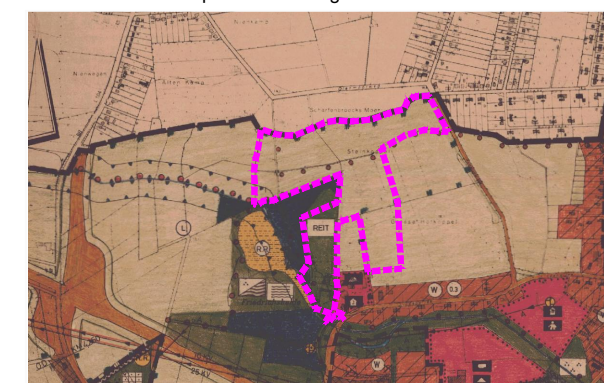
Ausschnitt aus dem Flächennutzungsplan SATZUNG ZUM VORHABENBEZOGENEN BEBAUUNGSPLAN NR. 84